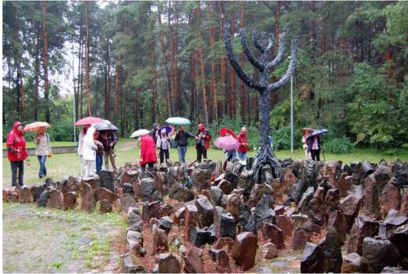
Gedenkstätte Rumbula – das lettische Babij-Jar

Zu einer Nachmittagsveranstaltung unter dem Thema: „ Wo sind sie geblieben? “ lädt die AG Bergen-Belsen ein und berichtet über ihre Reise nach Lettland und die Gedenkorte in und um Riga. Zu diesem Nachmittag sind Mitglieder und Freunde der AG-Bergen-Belsen sowie alle am Thema Interessierten herzlich eingeladen.